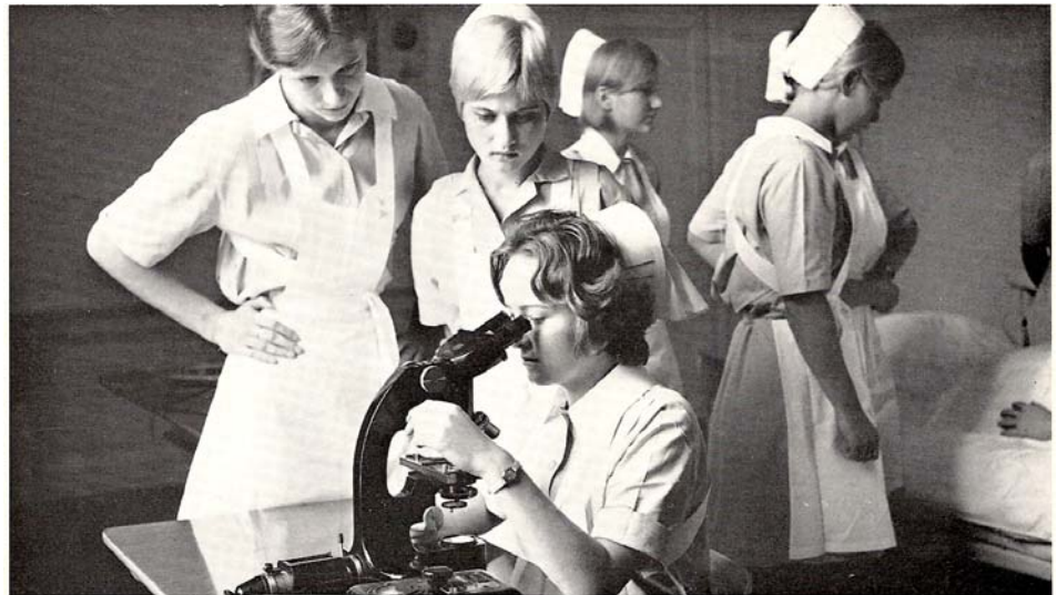
Praktischer Unterricht am Mikroskop