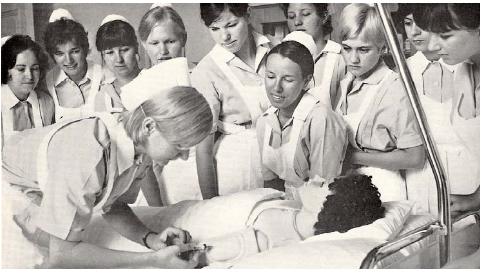
Praktischer Unterricht an der Patientenpuppe