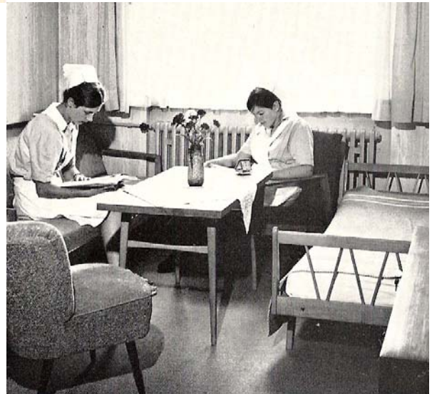
Blick in das Schwesternwohnheim