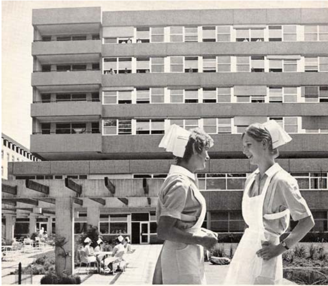
Krankenpflegeschule des Kreiskrankenhauses Gelnhausen