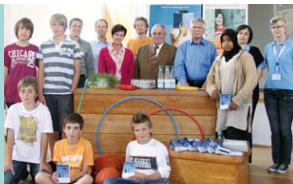
Aktionstag Bewegung an der Stadtschule Schlüchtern mit rd. 450 Schülern