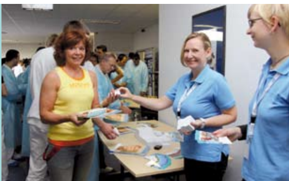
Aktionstag Bewegung und Ernährung bei der Firma Engelhard mit 150 Mitarbeitern

Sanitätshäuser und Rehabilitationseinrichtungen (z.B. Beratung vor Ort u.a. zu orthopädischen Fragestellungen)