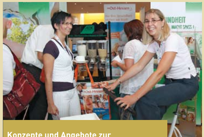
Konzepte und Angebote zur betrieblichen Gesundheitsbildung