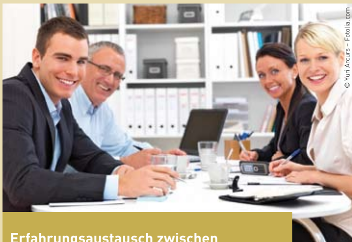
Erfahrungsaustausch zwischen Personalverantwortlichen