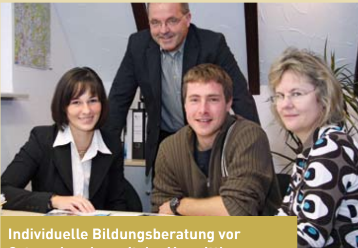
Individuelle Bildungsberatung vor Ort, verbunden mit der Vermittlung staatlicher finanzieller Hilfen

Unternehmen können auf das gesamte Leistungsspektrum der BiP mit ihren drei Produktsäulen (vgl. Rückseite dieser Informationsschrift) zurückgreifen. Denn es umfasst neben den maßgeschneiderten Lösungen zur Personalentwicklung des CBB noch mehr.