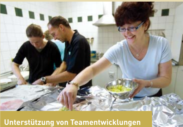
Unterstützung von Teamentwicklungen in Unternehmen, beispielsweise durch Kochkurse