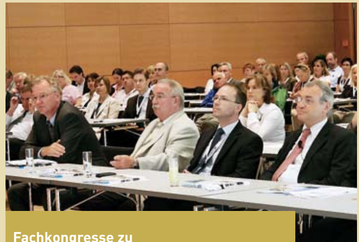
Fachkongresse zu Bildungsfragen