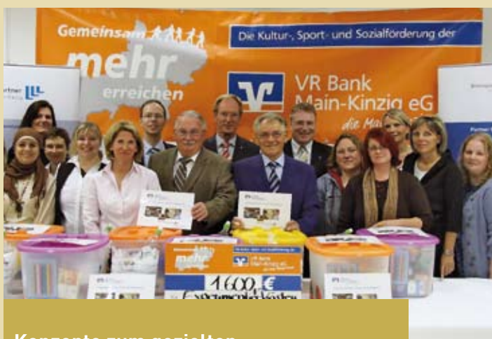
Konzepte zum gezielten Bildungssponsoring