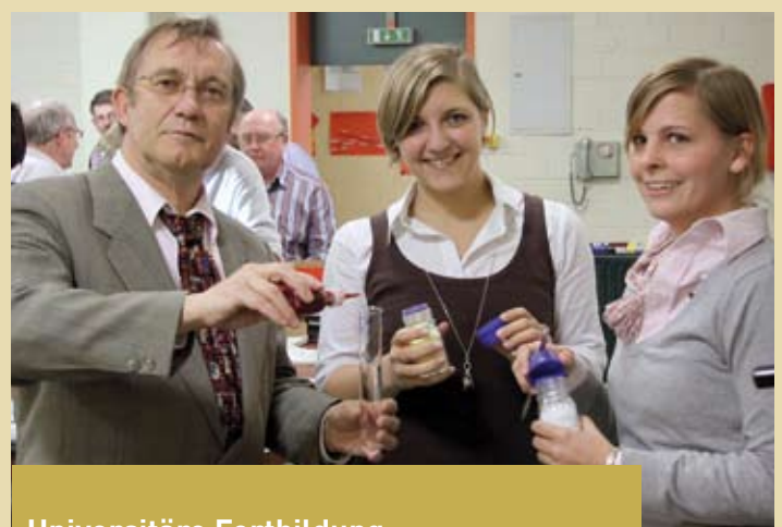
Universitäre Fortbildung für Berufstätige