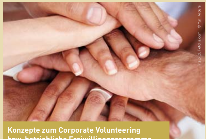
Konzepte zum Corporate Volunteering bzw. betriebliche Freiwilligenprogramme und Strategien zum Perspektivwechsel als Mittel moderner PE